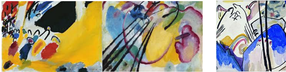
Boven: Impressie III Boven rechts: Studie Compositie IV Onder: Compositie IV 1911

Een concert van Arnold Schönberg in 1911 in München inspireerde Wassily Kandinsky tot de vrijwel abstracte compositie Impressie III waarvan bekend is dat hij het diezelfde avond nog schilderde.